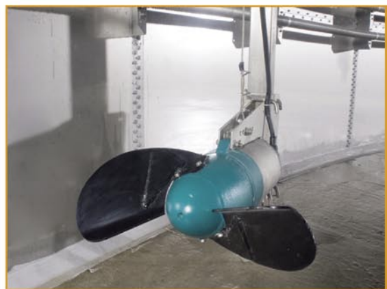
Nesteen sisäinen sekoittaja

Birrconsult Oy Karpilantie 20 FIN-90450 Kempele erwin@birrconsult.com