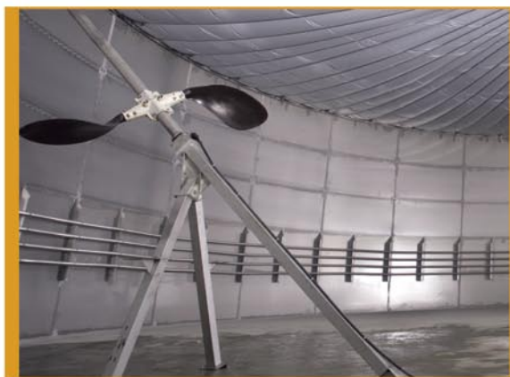
Pitkäakselinen sekoittaja reaktorissa

Moottori ja laakerituki ovat reaktorin ulkopuolella. Ne tuodaan vinossa kulmassa kaasutiiviin seinän läpi sisään.